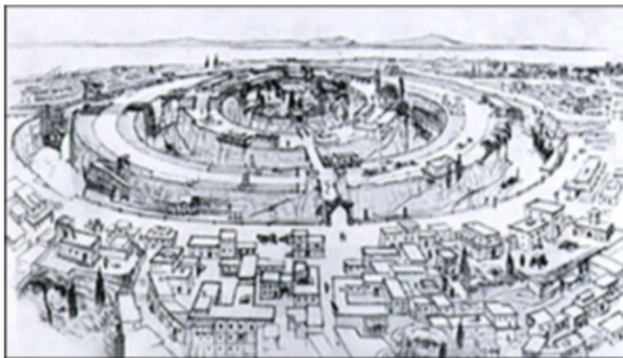
La capitale de l'Atlantide, d'après la description de Platon. Illustration tirée de Unsere Ahnen und Atlanten d'Albert Herrmann, 1934